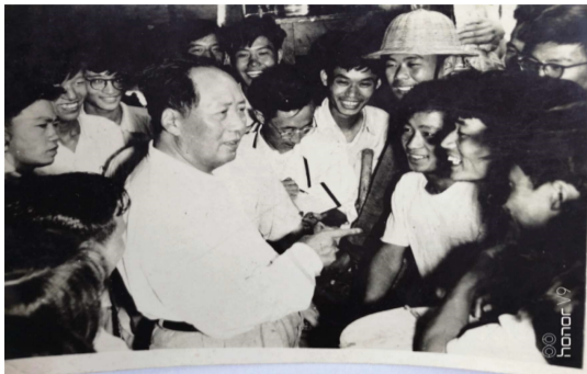
图1 1958年毛主席视察南开大学时与我们交谈时留影（右前数第3人是我）

我们这群年轻人，就这样在校园里磨砺了一个学年后，迎来了令我们铭记一生的时刻。1958年8月13日，我正在校内化工车间和同学们一起实习，毛主席来视察南开大学。主席走到我们身边，和我们交谈。交谈中，主席听出我的湖南口音，便问我，你是湖南来的吗？我说，我是湖南的。主席说，那我们是老乡了。就像做梦一样，