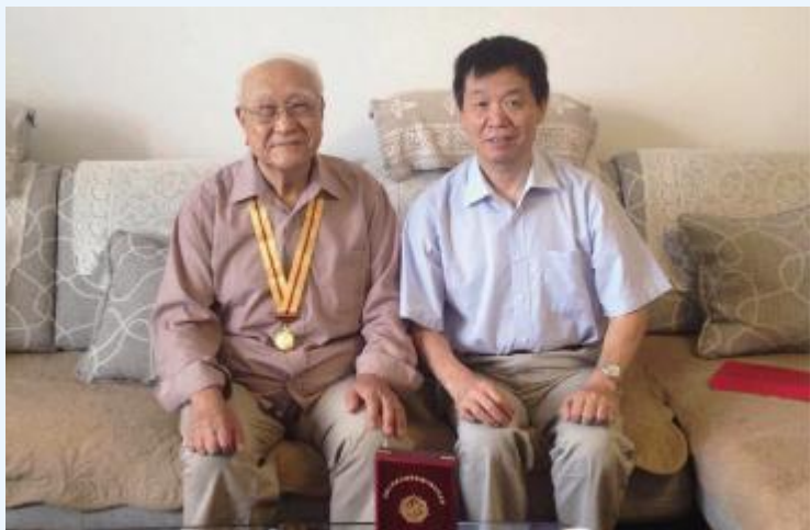
农业部副部长、中国农科院院长李家洋走访慰问抗战老战士刘磊同志

唐华俊、雷茂良、李金祥、吴孔明、史志国、王汉中、魏琦等院领导以及院属各单位领导也分别进行了走访慰问。(院离退休办)