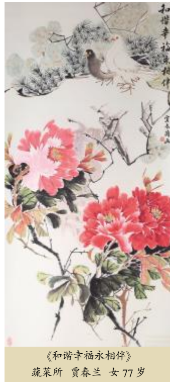
《和谐幸福永相伴》 蔬菜所 贾春兰女 77岁