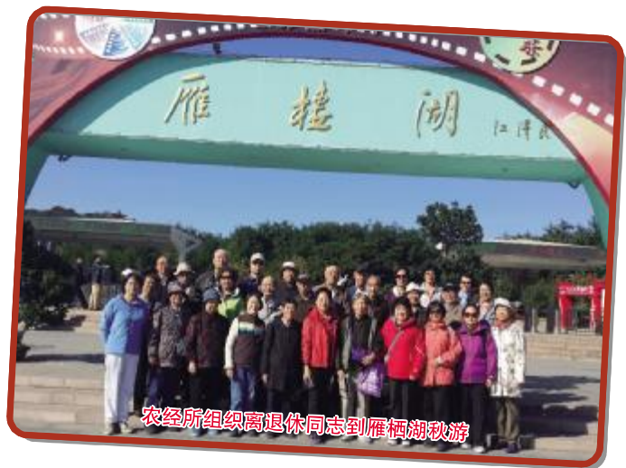
农经所组织离退休老同志到雁栖湖秋游