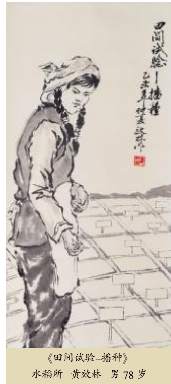
《田间试验—播种》 水稻所 黄效林男 78岁