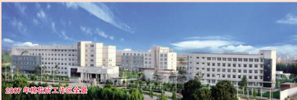
2007年棉花所工作区全景