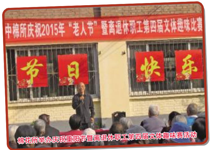
棉花所举办庆祝重阳节暨离退休职工第四届文体趣味赛活动